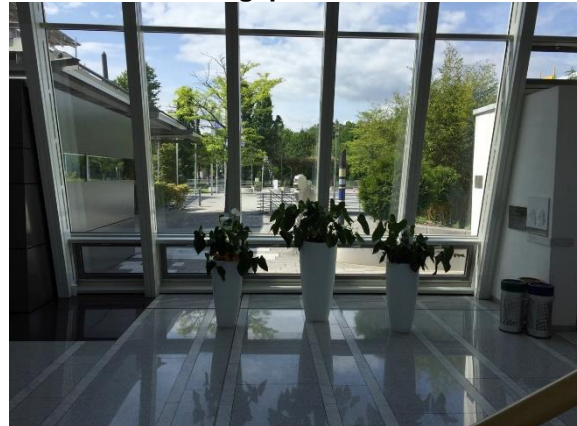
Ausstellungsplätze A3 und A4