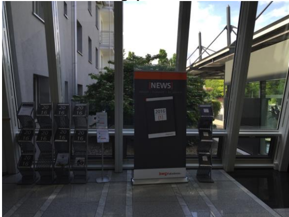
Ausstellungsplätze A1 und A2